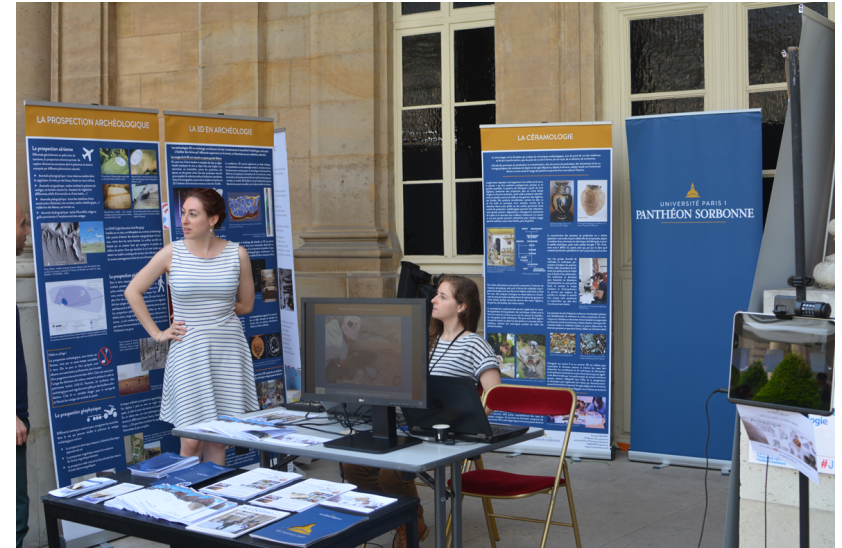
Journées Nationales de l'archéologie 2017

Débouchés : postes de médiateur en archéologie au sein de collectivités territoriales, de musées, d'établissements publics et d'opérateurs d'archéologie préventive (INRAP, ONF) ou dans le milieu associatif.